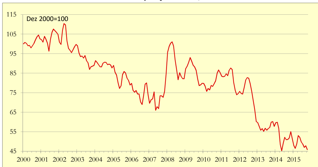
Gráfico 1: Indicador de Poupança APFIPP/Universidade Católica