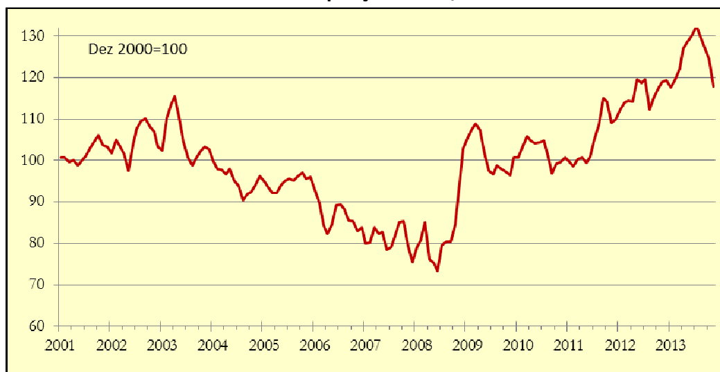
Gráfico 1: Indicador de Poupança APFIPP/Universidade Católica