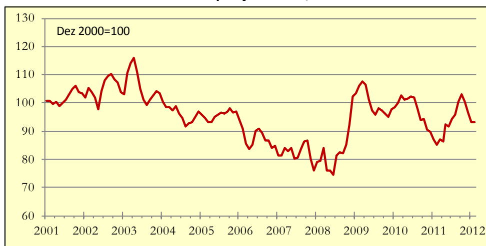
Gráfico 1: Indicador de Poupança APFIPP/Universidade Católica