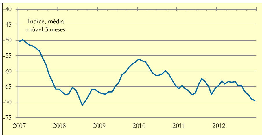
Gráfico 3: Expectativas das famílias portuguesas sobre a sua capacidade de poupança futura

Em Dezembro o inquérito da Comissão Europeia às famílias regista mais uma redução na expectativa da capacidade de poupança, o que poderá reflectir-se em uma diminuição da poupança actual.