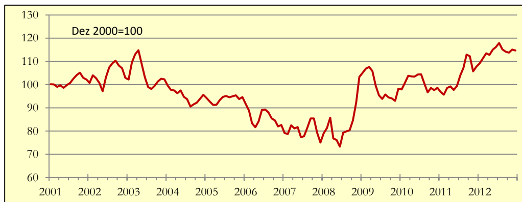
Gráfico 1: Indicador de Poupança APFIPP/Universidade Católica