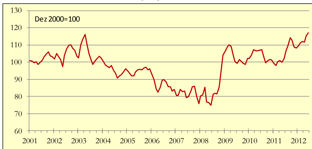
Gráfico 1: Indicador de Poupança APFIPP/Universidade Católica