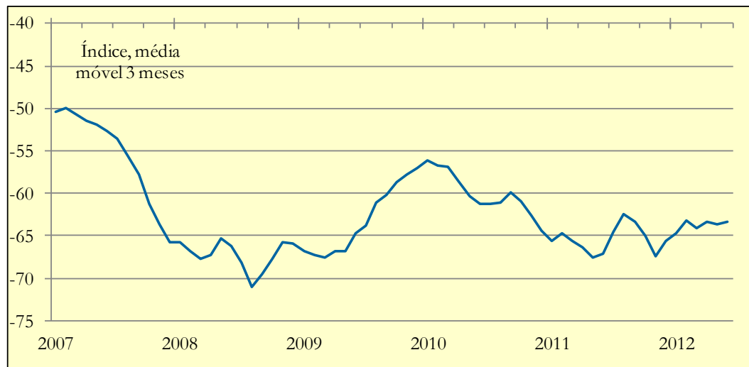
Gráfico 3: Expectativas de poupança