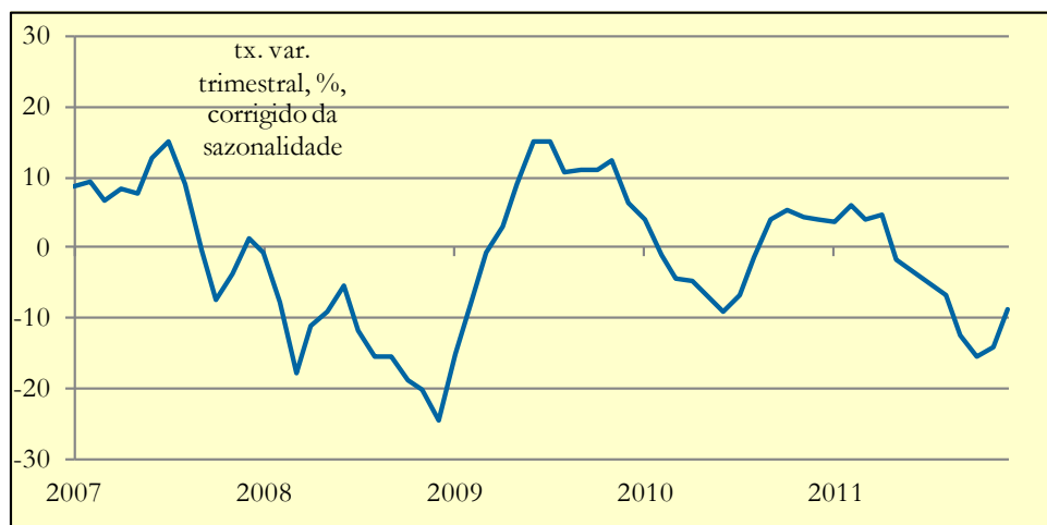
Gráfico 3: PSI Geral