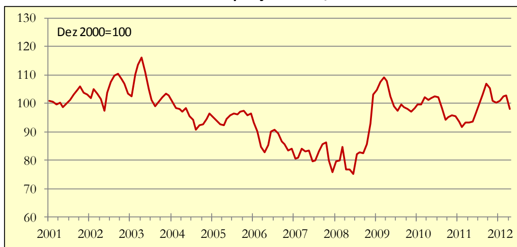
Gráfico 1: Indicador de Poupança APFIPP/Universidade Católica