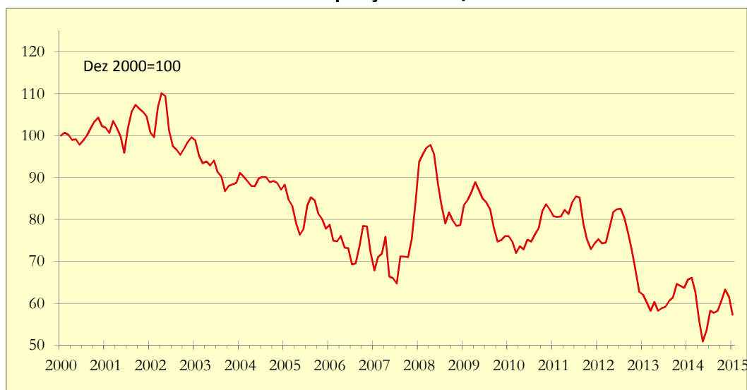
Gráfico 1: Indicador de Poupança APFIPP/Universidade Católica