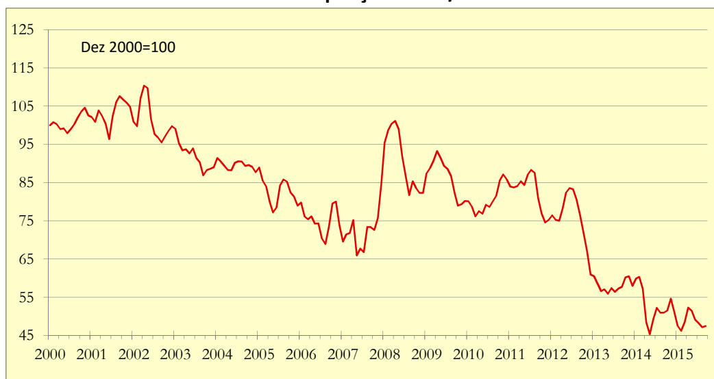
Gráfico 1: Indicador de Poupança APFIPP/Universidade Católica