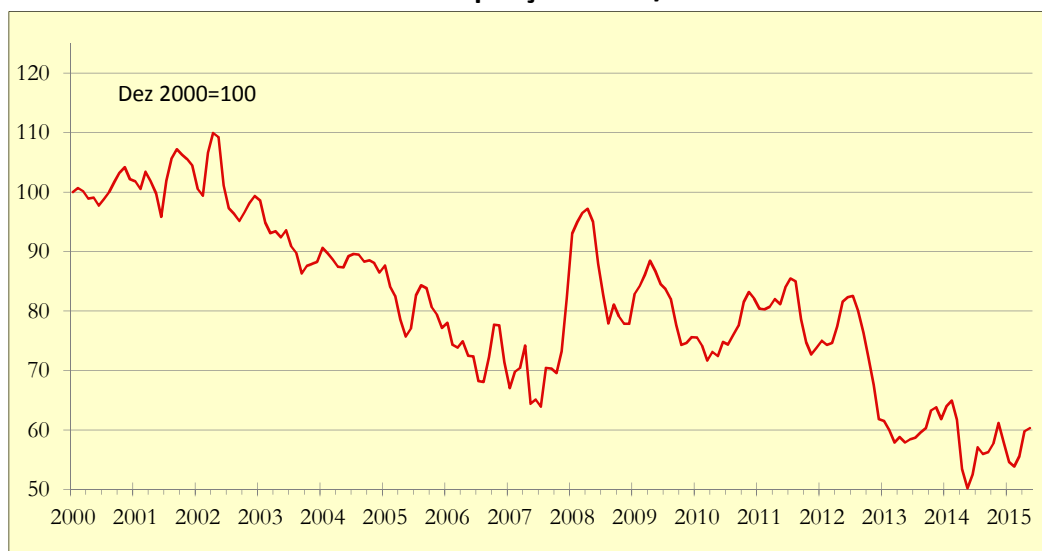
Gráfico 1: Indicador de Poupança APFIPP/Universidade Católica