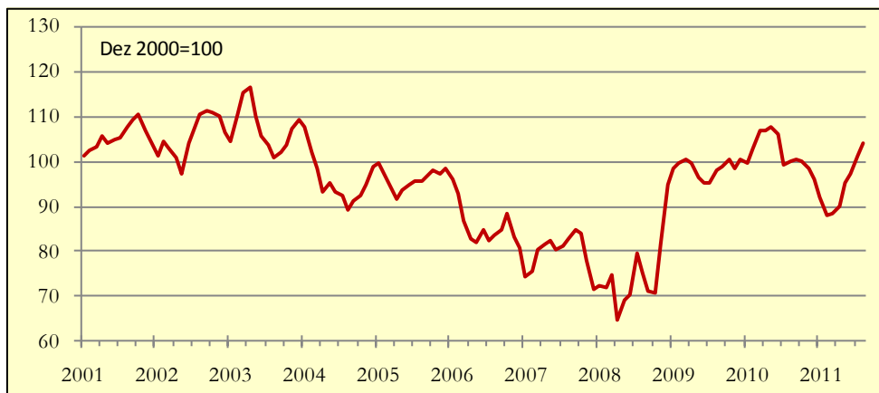
Gráfico 1: Indicador de Poupança APFIPP/Universidade Católica