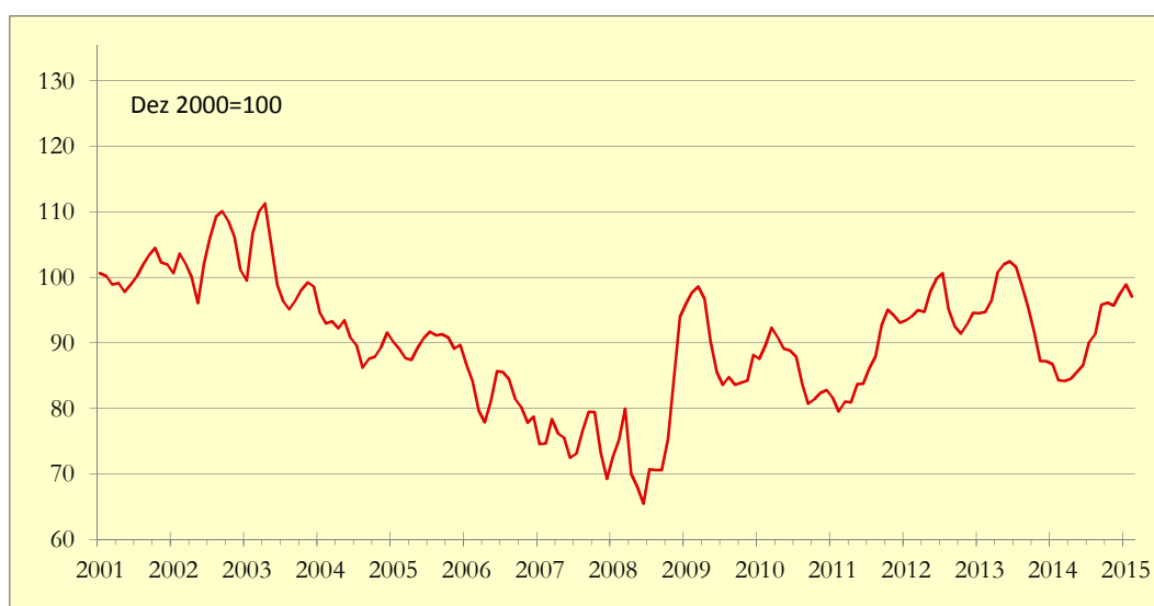
Gráfico 1: Indicador de Poupança APFIPP/Universidade Católica