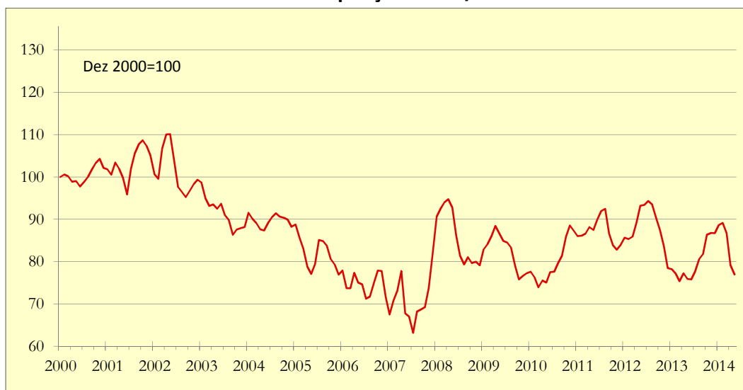
Gráfico 1: Indicador de Poupança APFIPP/Universidade Católica